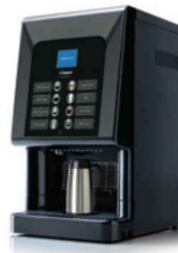
Phedra Evo Cappuccino